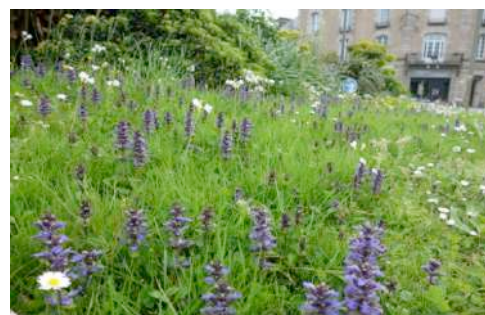
Ville de Dinan – Printemps 2020

Les plantes sauvages non seulement embellissent les espaces de vie mais jouent également un rôle essentiel pour les oiseaux et pour les pollinisateurs tels que les papillons, les abeilles, bourdons et bien d'autres animaux encore.