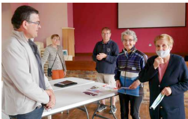
Samedi 20 juin : distribution des masques réalisés par les bénévoles

Afin de permettre aux habitants de Saint-Maden de se protéger du virus Covid-19, la commune de Saint-Maden s'est mobilisée pour commander, acheter et assurer la distribution de masques homologués, entre le 15 mai et le 20 juin. Cette mobilisation communale s'est faite en lien avec Dinan Agglomération qui a réalisé des commandes groupées pour le territoire et co-financé à hauteur de 50 % les masques commandés. La commune a financé les autres 50 % du coût des masques, ce qui a permis d'en offrir un à chaque habitant.